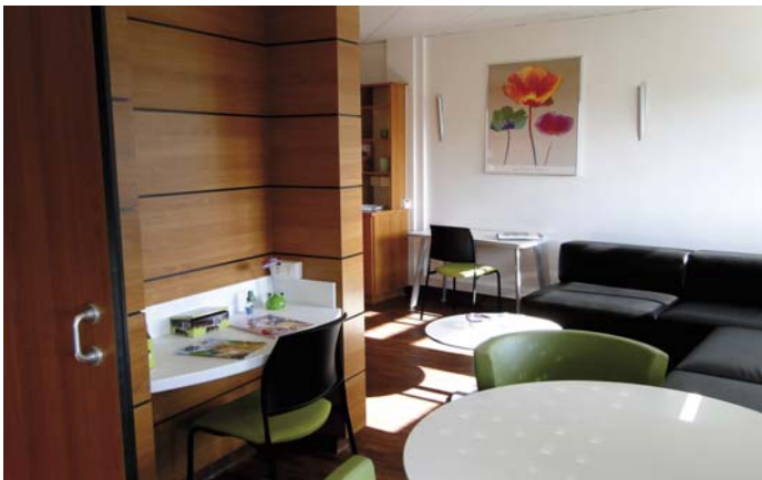
Espace d'accueil des familles