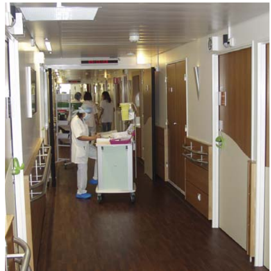
La nouvelle unité de soins